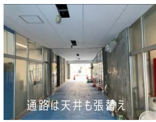
通路は天井も張替え

塗装の色は、作業部会で議論し鹿児島県庁と同じような薄いあざき色と決まり、理事会でも承認されました。