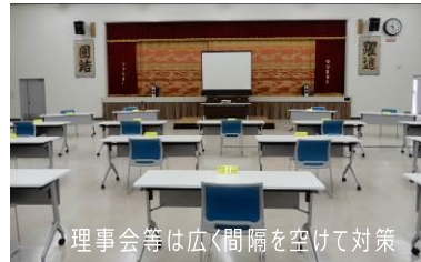
理事会等は広く間隔を空けて対策

今後コロナウイルスの状況を注視しながら出来る限りの対策を行って運営して参ります。ご不便をお掛けしますが、ご協力をお願い致します。