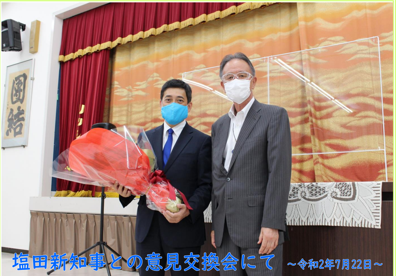
塩田新知事との意見交換会にて ~令和2年7月22日~