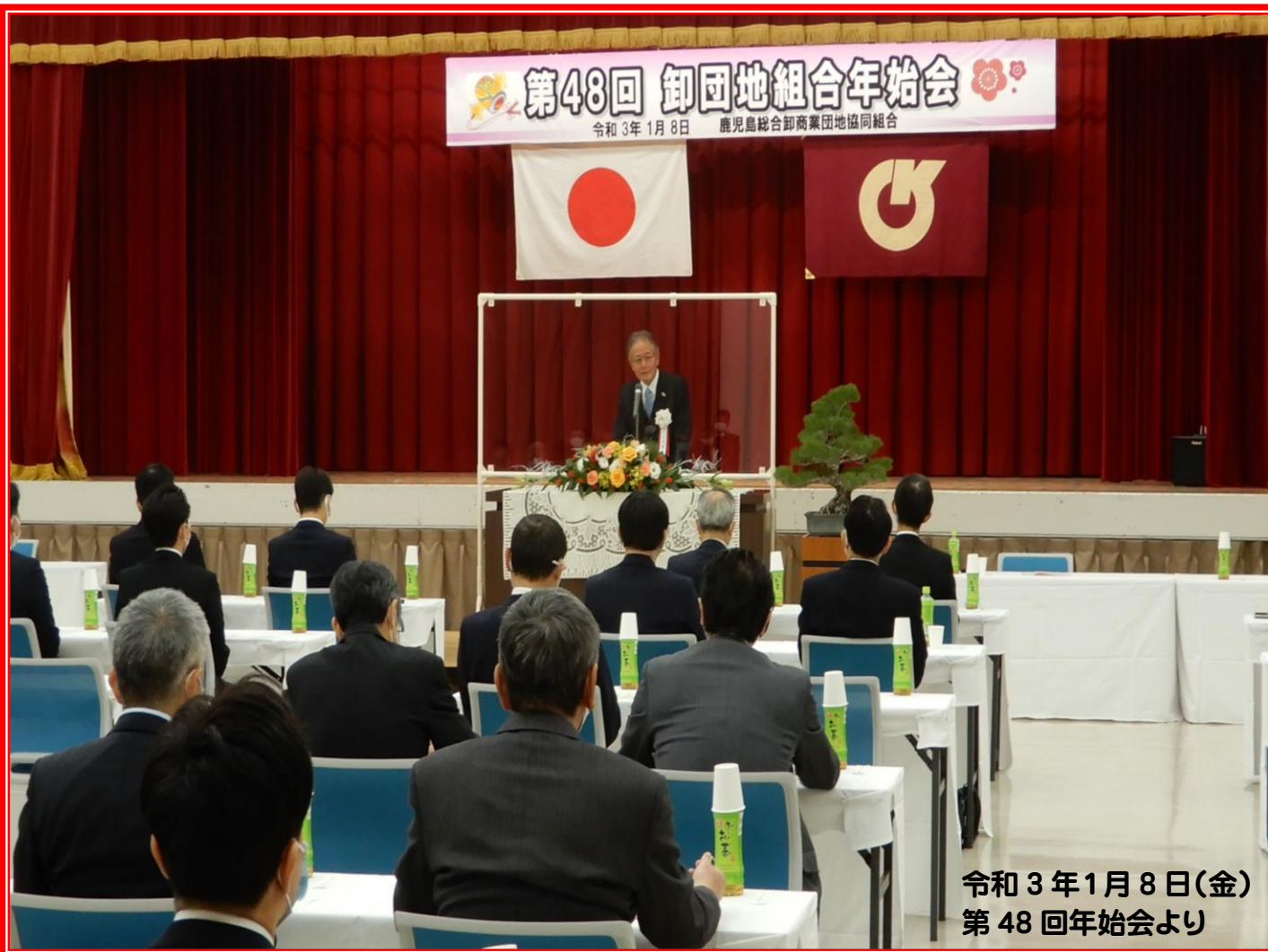
令和3年1月8日(金) 第48回年始会より